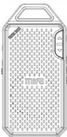
یک دستگاه mifa 4